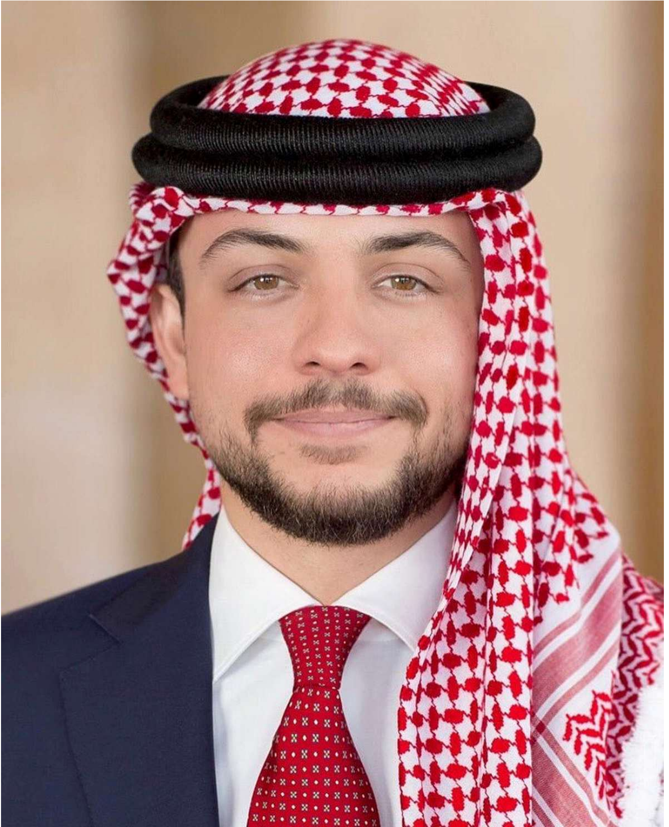
صاحب السمو الملكي الأمير الحسين بن عبدالله الثاني ولي العهد المعظم حفظه الله