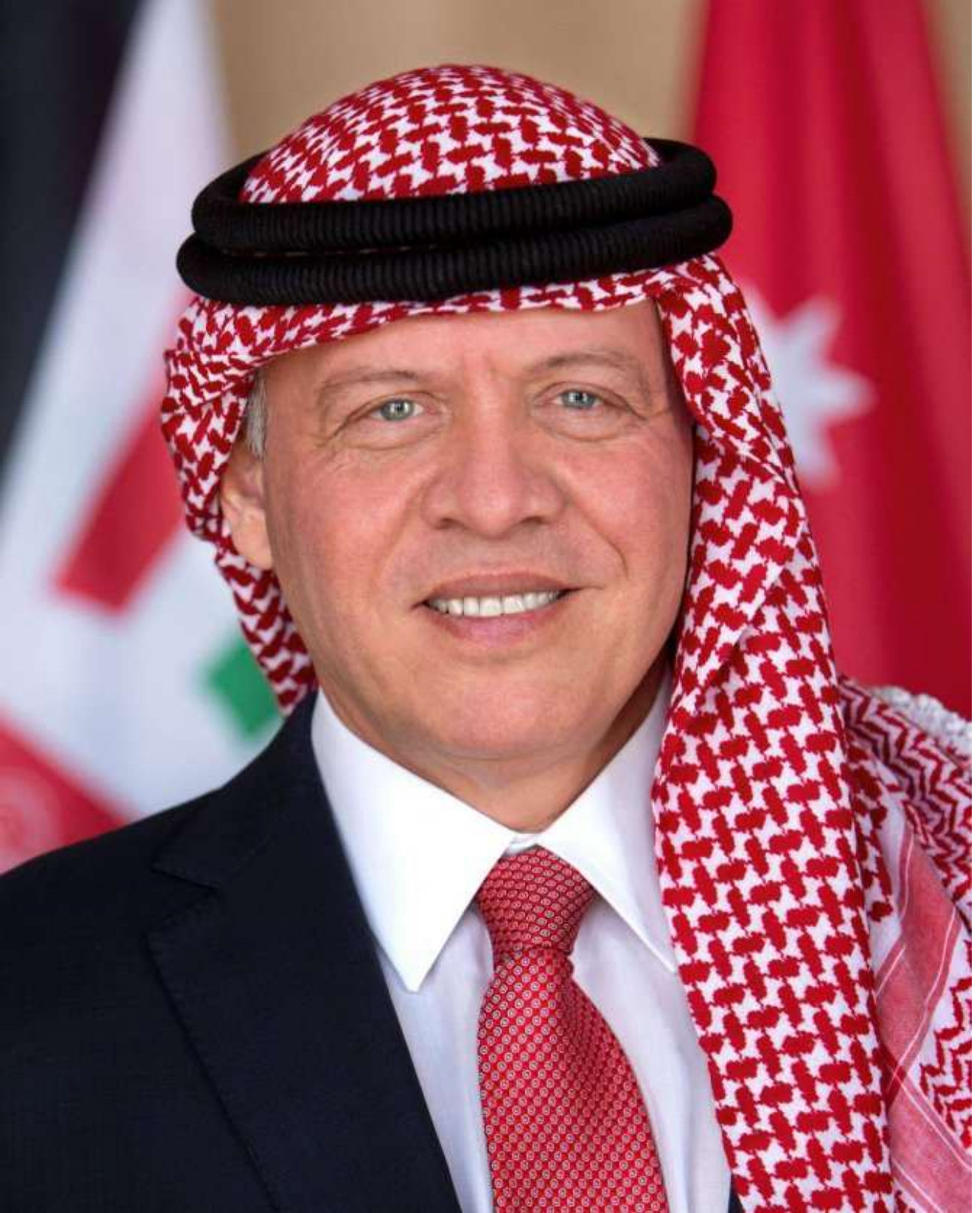
حضرة صاحب الجلالة الهاشمية الملك عبدالله الثاني ابن الحسين المعظم حفظه الله